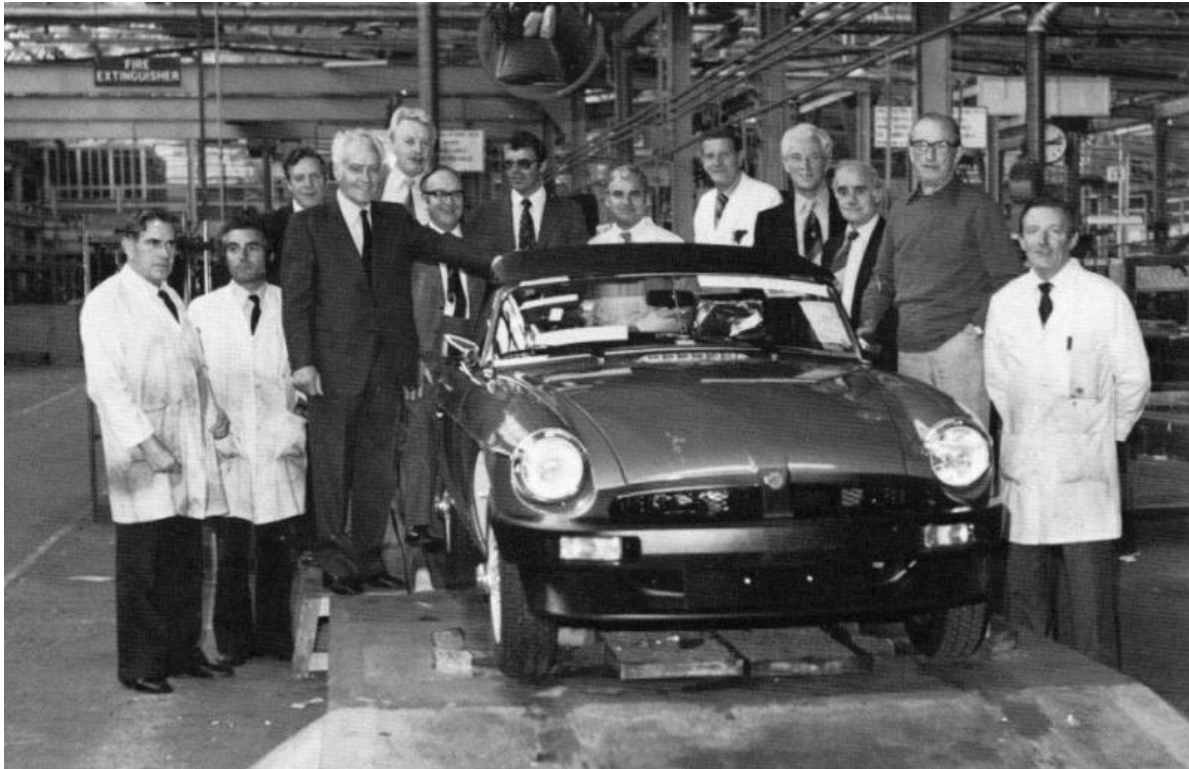
Foto-4 De laatste MGB op de productielijn in Abingdon

'ladderchassis'. Van deze fraai gelijnde sportwagen die tot 1962 werd geproduceerd, werden in totaal 101081 stuks verkocht. De MGA werd opgevolgd door de MGB, de eerste betaalbare sportauto met een zelfdragende carrosserie. Wereldwijd werd dit een groot succes. De productie van dit model duurde 19 jaar en in totaal werden 512112 stuks in diverse uitvoeringen verkocht. Tot aan het einde in 1980 werden in Abingdon 850.000 MG's geproduceerd. De laatste MGB die van de productielijn rolde, staat nu in een klein MG-museum in Abingdon on Thames, UK.