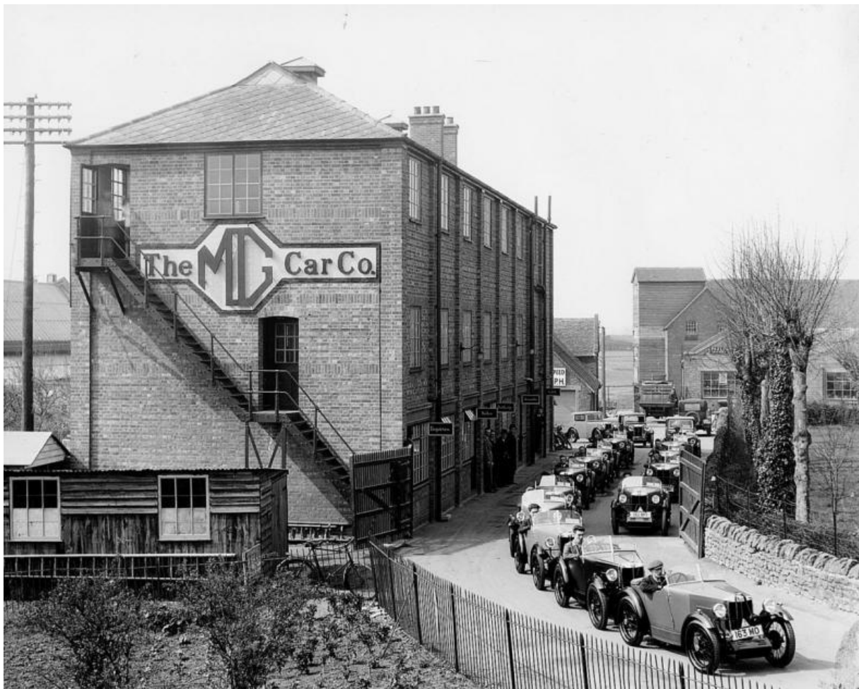
Foto-3. The MG Car Company in Abingdon on Thames UK met een rij MG M types klaar voor een gezamenlijke proefrit door de omgeving.