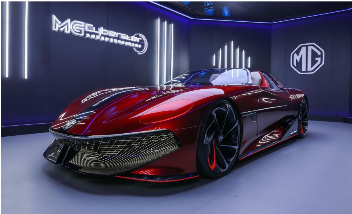
Foto-5 de MG Cyberster